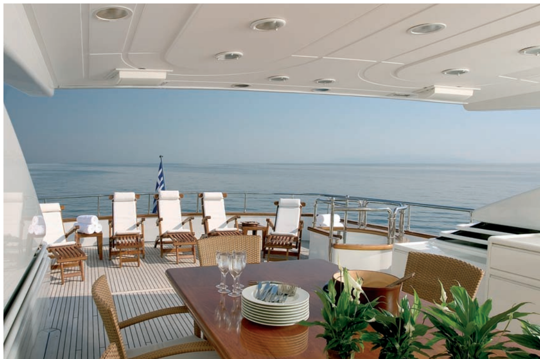
Le yachting, "immobilier de l'océan".